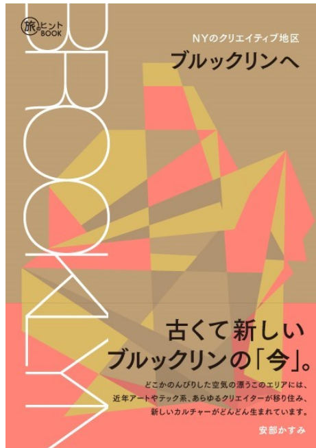
旅のヒント BOOKシリーズ『NYのクリエイティブ地区 ブルックリンへ』（安部かすみ 著、イカロス出版刊）

イカロス出版から発行されている旅のヒントBOOKシリーズの新刊『 NYのクリエイティブ地区 ブルックリンへ 』が、2018年3月2日（金）に発売予定。